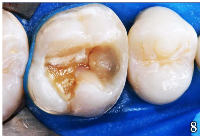
Figura 8: Reconstrucción del esmalte