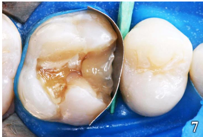
Figura 7: Matriz y cuña

En la pieza 26 se utilizó una matriz para adaptar la resina, y una cuña de madera para proporcionar un espaciamiento ideal durante la reconstrucción del punto de contacto (Figura 7). La restauración fue iniciada por las caras proximales, utilizando la técnica incremental, con capas de hasta 2 mm. de grosor, fotoactivadas durante 20 segundos. Para la reconstrucción del esmalte se utilizó la resina Brilliant de color A2 (Figura 8). Para la dentina se utilizó el color A3 (Figura 9) con tintes amarillo y blanco (Fill Magic Cores, Vigodent, Rio de Janeiro, R.J., Brasil) fotoactivados durante 20 segundos cada aplicación (Figura 10). Se finalizó la restauración con resina de color esmalte A1 definiendo la escultura y la forma oclusal (Figura 11).