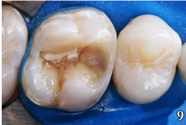
Figura 9: Reconstrucción de dentina