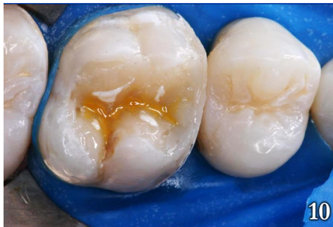
Figura 10: Tintes amarillo y blanco