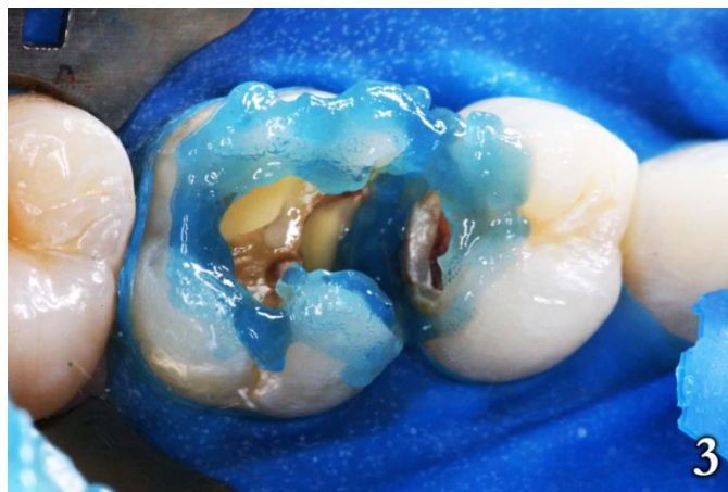
Figura 3: Grabado ácido en esmalte

Luego se lavó con un chorro de agua durante 60 segundos y se secó (Figura 5), para posteriormente aplicar un sistema adhesivo, (One Coat Bond, Coltene, Cuyahoga Falls, Ohio, USA) en toda la cavidad realizada de forma activa, cerciorándose de difundir uniformemente el adhesivo en toda la región preparada, para formar una capa regular. Luego se procedió a la evaporación del solvente a través de un leve chorro de aire, para finalmente fotopolimerizar durante 20 segundos.