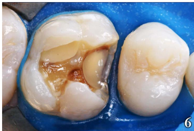
Figura 6: Restauracion de la pieza 25

Inicialmente se confeccionó la restauración de la pieza 25 para facilitar la construcción del punto de contacto utilizando la resina compuesta Brilliant de color A3, seguida de la resina Helio Fill AP de color A2 en la capa superficial (Figura 6).