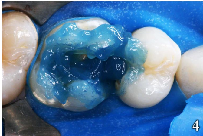
Figura 4: Grabado acido en dentina