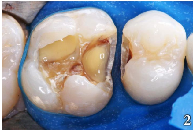
Figura 2: Protección cavitaria con hidróxido de calcio

Con el objetivo de mejorar el sellado marginal, se realizó el grabado con ácido fosfórico al 37% durante 30 segundos en la región del esmalte (Figura 3) y 15 segundos en la dentina (Figura 4).