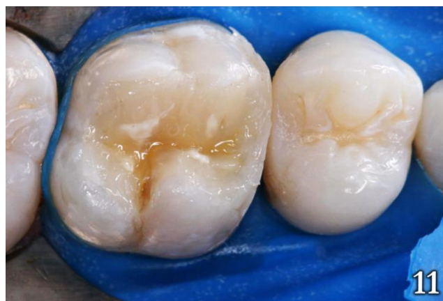
Figura 11: Resina de color esmalte