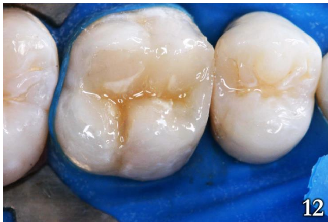
Figura 12: Capa de sellante resinoso fotopolimerizable

Una vez finalizada la restauración, se procedió a verificar los puntos de contactos oclusales y la mordida posterior. Después del acabado y pulido inicial con puntas de silicona (Optimize, TDV, Pomerode, SC, Brasil) se aplicó una capa de sellante resinoso fotopolimerizable, (Fill Glaze, Vigodent, Rio de Janeiro, R.J., Brasil) durante 10 segundos (Figura 12).