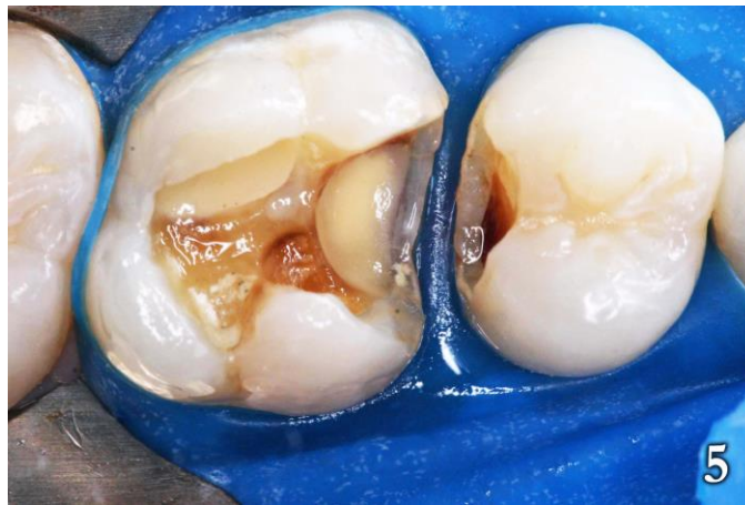
Figura 5: Lavado y secado

Inicialmente se confeccionó la restauración de la pieza 25 para facilitar la construcción del punto de contacto utilizando la resina compuesta Brilliant de color A3, seguida de la resina Helio Fill AP de color A2 en la capa superficial (Figura 6).