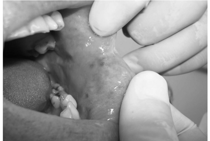
Figura 2. Lesão elevada, circunscrita, com bordos definidos, de superfície lisa, relativamente flácida à palpação e assintomática.

Após todo o exame clínico, o prognóstico se apresentou favorável e a paciente foi encaminhada para o departamento de periodontia da Faculdade de Odontologia da Universidade Federal de Juiz de Fora, a fim de solucionar a sua queixa principal, o elemento 13 impactado.