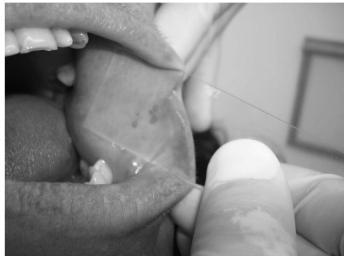
Figura 3. Manobra de vitropressão - lesão de coloração pálida e de menor tamanho.